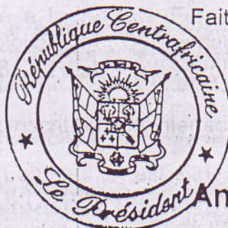
Ange Félix PATASSE