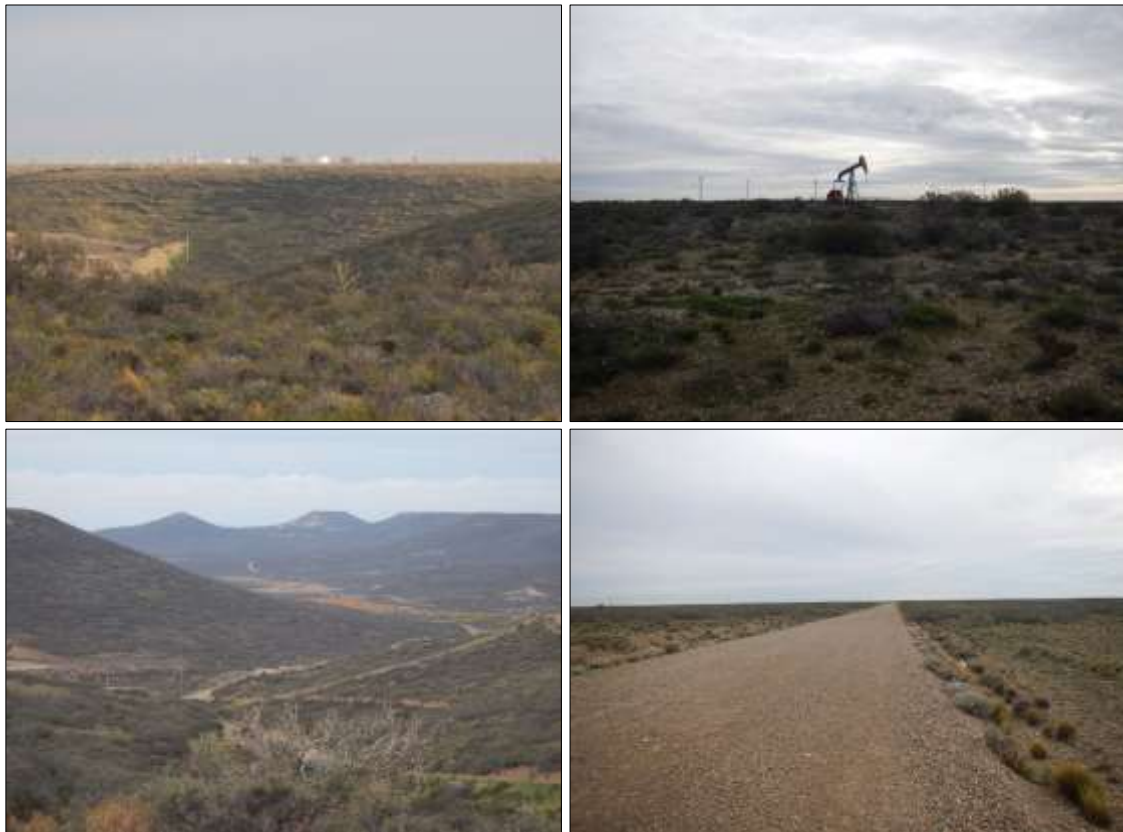
Fotos 2 a-b-c-d. Instalaciones petroleras varias y red vial interna del Yacimiento Cañadón León.

Sobre el área del Proyecto, se observa un ambiente con alteraciones de origen natural (fenómenos de deflación, erosión hídrica, etc.) además de antrópico. Esta última consecuencia de la actividad petrolera principalmente la cual data dentro de los Yacimientos Cañadón León y Cañadón Seco, con más de 50 años ininterrumpidos de desarrollo. Por otro lado, la actividad ganadera propia de la región también generó su propia modificación del paisaje, donde se observan lotes con alto grado de sobrepastoreo, además instalaciones de diversa índole, tales como alambrados, guardaganados, pozos de agua. (Ver Fotos 2 a-b-c-d).