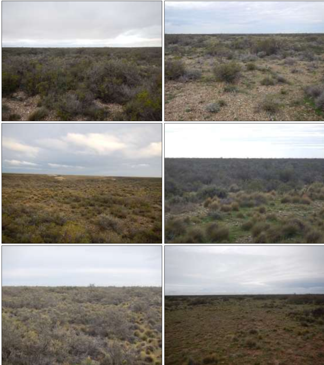
Fotos 1 a-b-c-d-e-f. Vistas varias del área del Proyecto. Locaciones Ag-5, 8, 14, 20, 30 y 35, respectivamente.